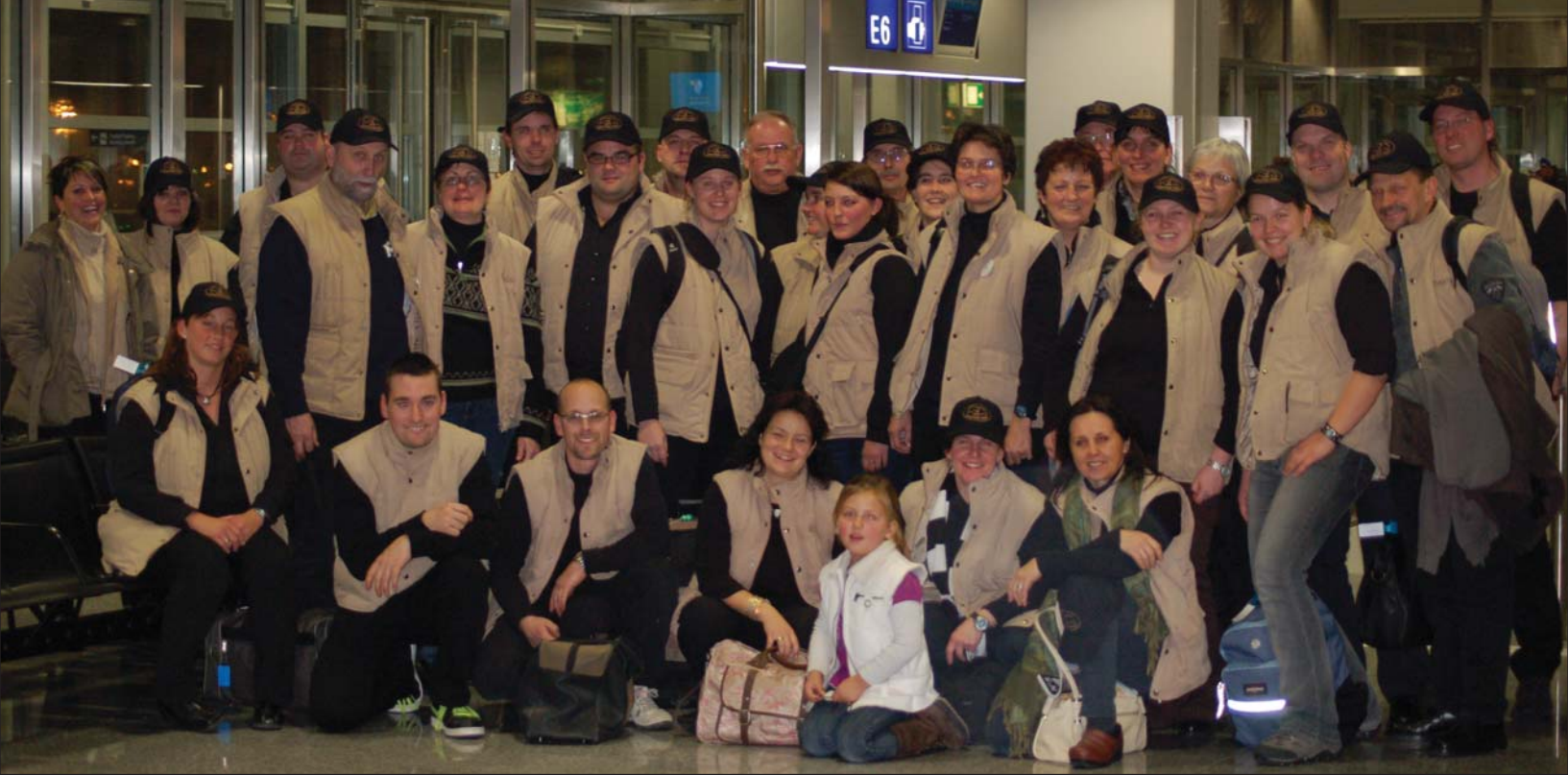
Gruppenbild vorm Abflug: 32 aufgeregte Oman-Reisende.