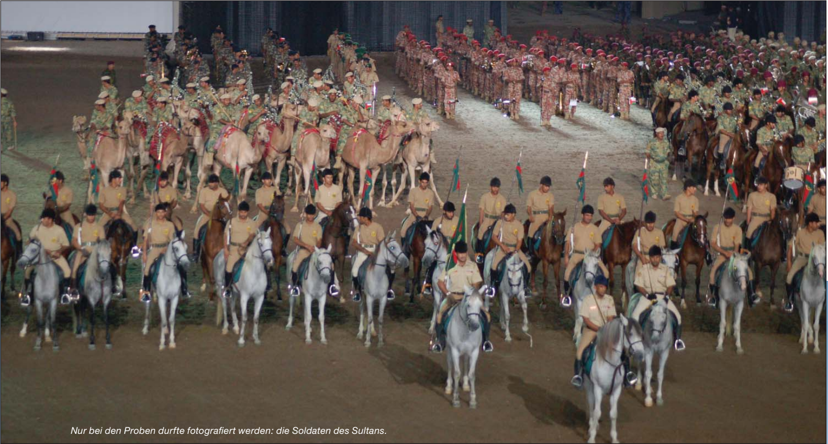
Nur bei den Proben durfte fotografiert werden: die Soldaten des Sultans.

abgebildet und in arabisch sowie englisch erklärt. Fotografieren und Telefonieren war während des Festivals strikt verboten, Sicherheitsstufe eins. Wie Timo Münch feststellte, hielten sich nicht alle Zuschauer ans Verbot, trotz des Risikos, dass die Kamera vom Sicherheitspersonal einbehalten wurde. Als das Ehepaar Münch nach dem Festival ins Hotel zurückkehrte, lief bereits im Oman TV eine Aufzeichnung des gesamten Events. Sie hätten eine Top-Show gebracht, lobte das Hotelpersonal das Fjord Fahr Team.