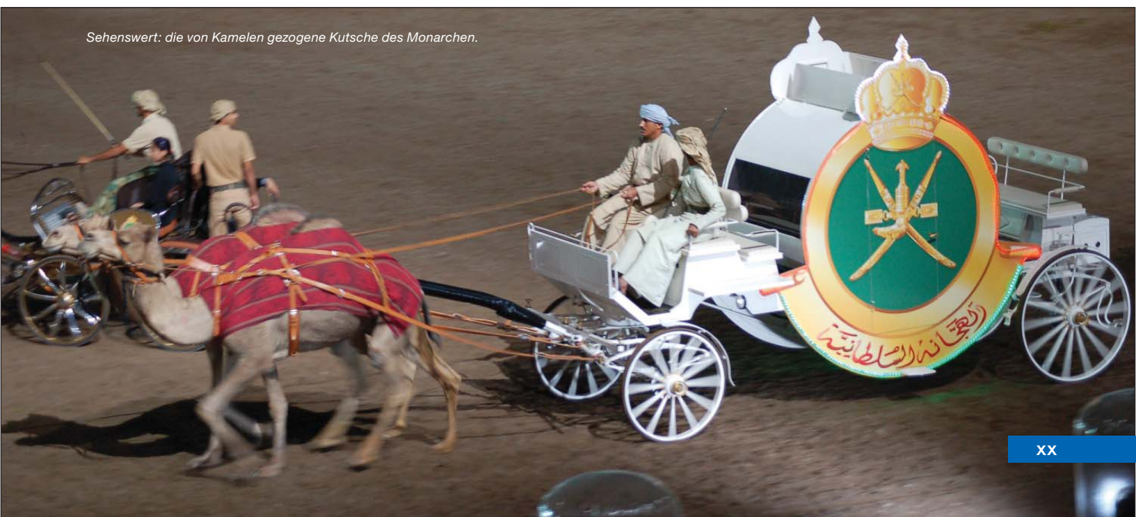
Sehenswert: die von Kamelen gezogene Kutsche des Monarchen.

Mit 13 Kutschen und 27 Pferden war das Fjord Fahr Team ins arabische Märchenland gereist, aber nur mit 23 Pferden kam es zurück. Für vier Stuten heißt das neue Zuhause Oman. Der Sultan hat vier Stuten gekauft. Für 2011 hat das Fjord Fahr Team noch keine konkrete Planung – die Oman-Eindrücke müssen erst mal verarbeitet werden. ■